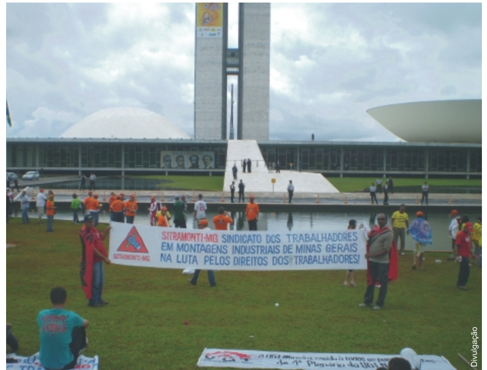
SITRAMONTI-MG participou da 5ª marcha de entidades trabalhistas a Brasília

O Sindicato convoca a todos os trabalhadores de montagens industriais dentro da Petrobras a se filiarem, preenchendo a ficha que encontra com a Comissão Tripartite, representante dos trabalhadores nas negociações coletivas. Neste dezembro, encaminhamos ofício a todas as empresas de montagens da Petrobras, informando-as sobre a oficialização do SITRAMONTI-MG e convidando-as para uma rodada de negociações sobre a pauta de reivindicações dos trabalhadores.